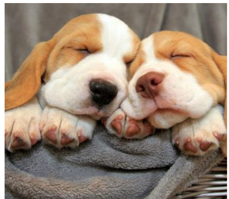
Weniger Schlaf am Wochenende auch für Haustiere

In Deutschland wurde die Einführung der Sommerzeit übrigens 1978 beschlossen, in Kraft trat die Regelung jedoch erst 1980. Viele Nachbarländer hatten die Sommerzeit bereits 1977 eingeführt, um durch die bessere Nutzung des Tageslichts Energie zu sparen. Schon seit es diese Regelung gibt, wird immer wieder darüber diskutiert, ob die Zeitumstellung eigentlich Sinn macht. Tatsächlich gibt es sogar eine politische Initiative zur Abschaffung der Sommerzeit. (alma)