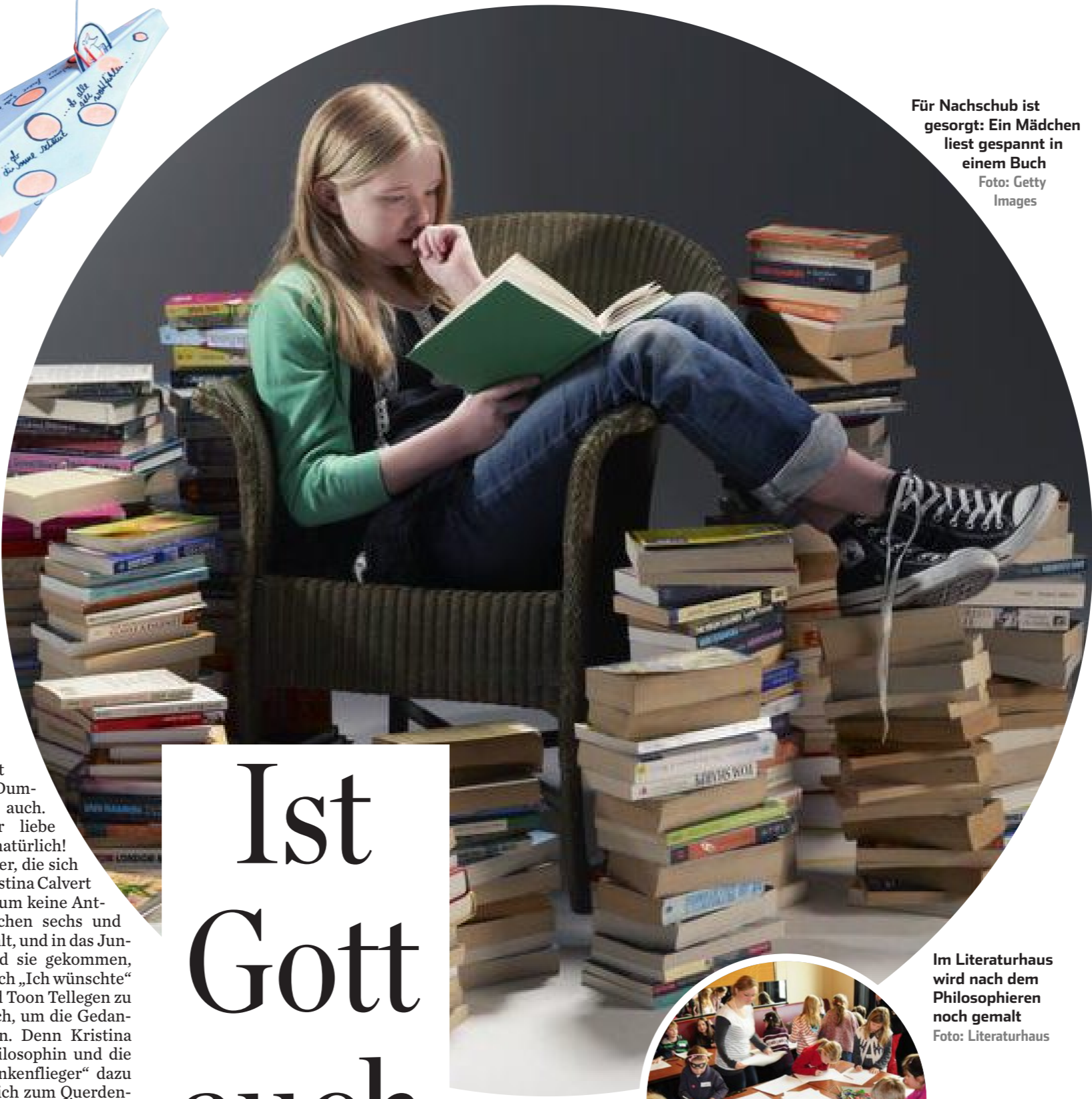
Für Nachschub ist gesorgt: Ein Mädchen liest gespannt in einem Buch

Dass am kommenden Mittwoch mit speziellen Aktionen an Schulen oder in Bibliotheken weltweit der Kinderbuchtag gefeiert wird, freut das Team vom Literaturhaus. Isabell Köster sagt aber auch: „Bei uns ist das ganze Jahr Kinderbuchtag.“ Damit meint sie nicht bloß die regelmäßig stattfindenden Lesungen für Vor- und Grundschüler, schließlich gehören auch Jugendliche und junge Erwachsene zu den Besuchern. Wer schon 14 ist, kann zum Beispiel zum Sta-Club kommen und mit richtigen Autoren zusammentreffen. Sogar der berühmte Günter Grass war schon da! Aber auch junge Schriftsteller, Performance-Künstler und Slam-Poeten (unter Poetry Slam versteht man einen Dichterwettbewerb, bei dem selbst ge-